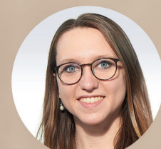
Franziska Jordan Studien- und Prüfungsorganisation